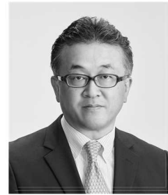
徳島大学 脳神経外科 准教授