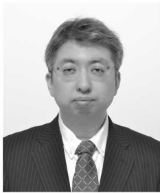
東京慈恵会医科大学 准教授 (先端医療情報技術研究講座)