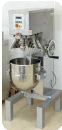
製菓・製パン用ミキサー