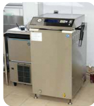
小型高温高圧調理機

真空包装容器に充填した食品を高温加圧下で殺菌・調理する機器。常温で長期保存が可能なレトルト食品の試作ができる。