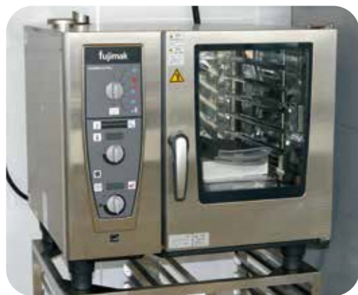
スチームコンベクションオープン

水蒸気と熱風の量を設定し、「焼く・煮る・蒸す・炊く」などができる多機能加熱調理機。惣菜、菓子の試作ができる。