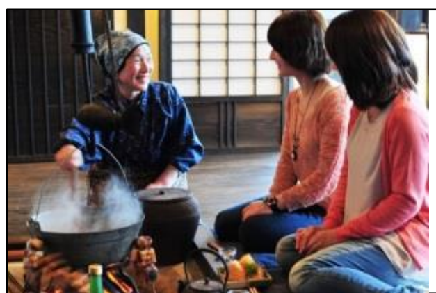
農泊による交流の促進

徳島県農林水産部農山漁村振興課 nousangyosonshinkouka@pref.tokushima.jp 徳島県西部総合県民局農林水産部 seibu_nrs_mm@pref.tokushima.jp