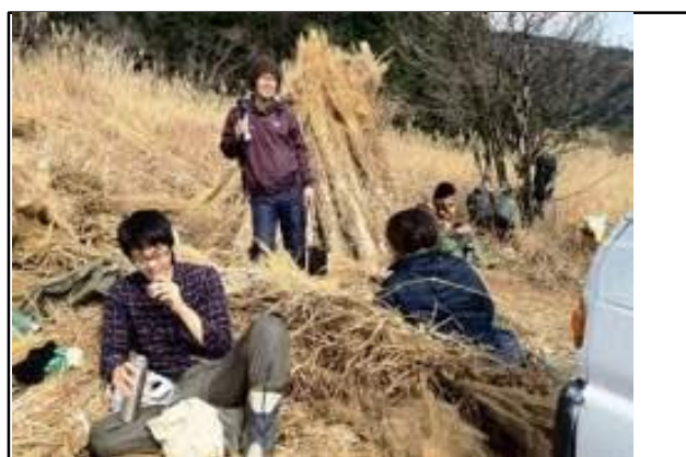
日本農業遺産に認定された傾斜地農業を体験