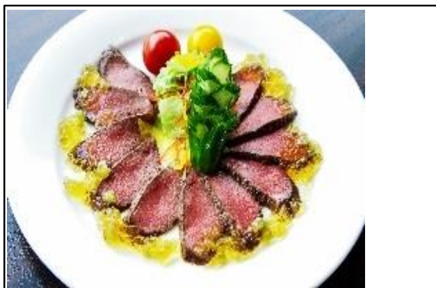
ジビエ料理の普及と消費拡大