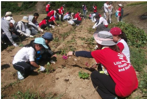
耕作放棄地を再生した農園での芋掘り体験

【日本イライリ(株)×淡路市興隆寺町内会】 地域のNPO法人が企業と集落の間をとりもち、連携活動を実施。耕作放棄地を再生・活用した農作物栽培や里道清掃などの活動により、社員と地域住民の交流を深めています。