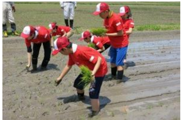
「アウトオブ キック コア神明農業体験」における田植えの様子

【(株)神明×三田市十倉集落】 企業の社会貢献活動として、交流田で小中学生を対象とした稲作からお米販売を体験する食育プログラムを行うとともに、水路掃除等の集落維持活動を実施しています