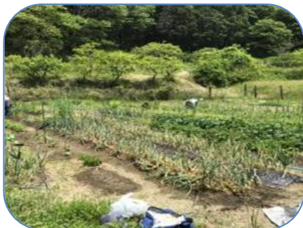
市民農園（しあわせ食材作り隊）