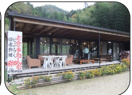
農家レストラン（土一七日屋台）

◎問合せ 兵庫県農政環境部農政企画局楽農生活室 〒650-8567 神戸市中央区下山手通5-10-1 電話：078-362-9198 FAX：078-362-4458 Eメール：rakuno@pref.hyogo.lg.jp