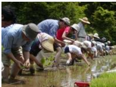
田植え作業（養父市高柳下）

（農作業）田植え、野菜苗の植付け、収穫、草刈り、水路・農道の手入れ （交流イベント）収穫祭、集落行事の準備・手伝い など