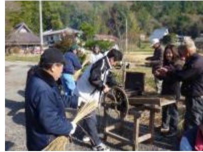
しめ縄づくり（篠山市西本庄）