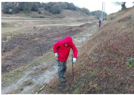
獣害防止柵設置（淡路市柳沢東）