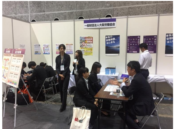
管工機材・設備総合展のイベントの様子

また、9月7日～9日に組合が主催する展示会（管工機材・設備総合展）の運営を手伝いながら、各社担当者から説明を受けるとともに実際の製品と営業の現場に触れることで業界と企業への理解を深めました。