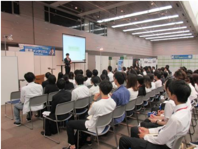
オープニングセミナーの様子

また、平成29年8月4日には、大阪府と連携して、地域の雇用創出を目的とした「ドリームマッチジョブフェア2017」（合同企業説明会）を開催し、成長力あふれる企業104社が出展し、546名の方が来場しました。