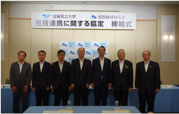
滋賀県立大学との協定締結式の様子

また、滋賀経済同友会の会員企業の社員を滋賀県立大学の「地域ひと・モノ・未来情報研究センター」に派遣するほか、共同で地域課題の解決に取り組みます。