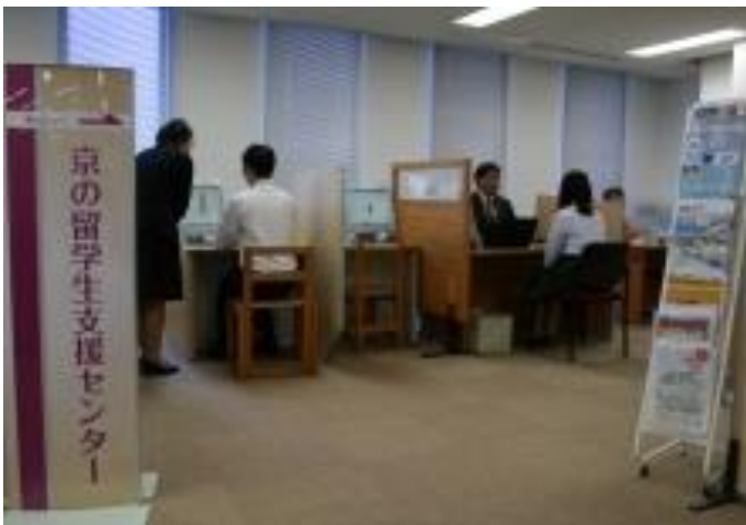
センター内の様子

京都府は、平成29年6月1日に、日本での就職を目指す外国人留学生を支援するため、京都ジョブパーク内に「京の留学生支援センター」を開設しました。