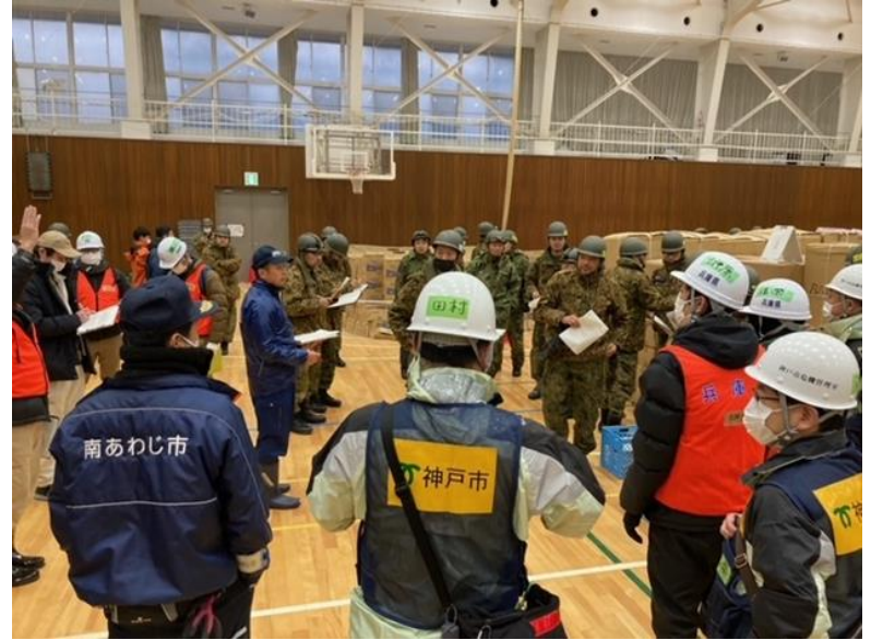
避難所支援チームミーティング(珠洲市健民体育館)