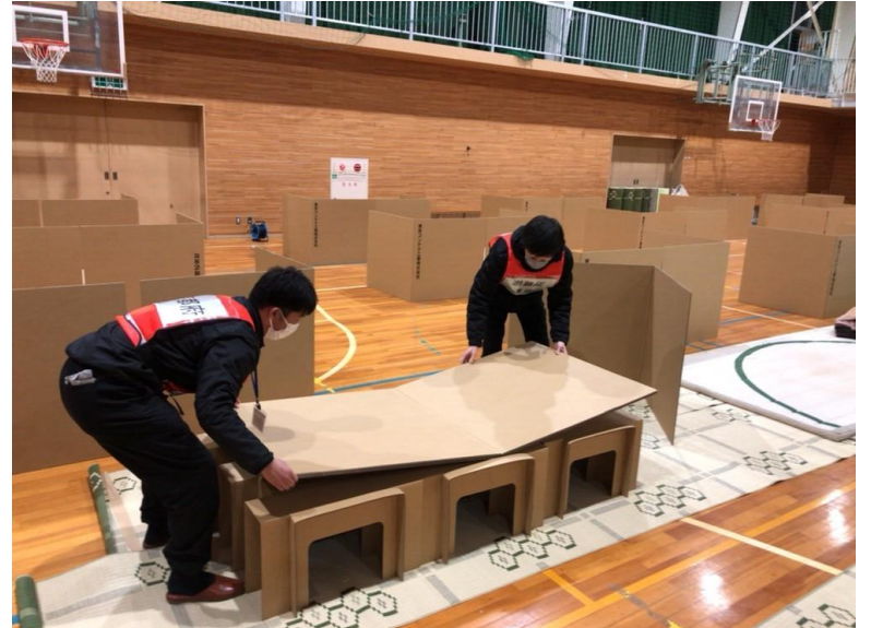
避難所支援(七尾市立中島小学校)