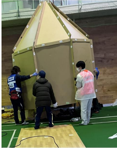
避難所支援(輪島中学校)