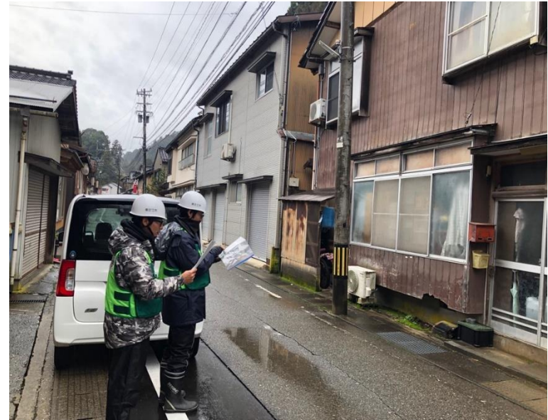
家屋被害認定調査の様子(能登町内)