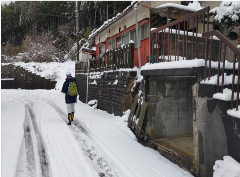
応急危険度判定の様子(志賀町内)