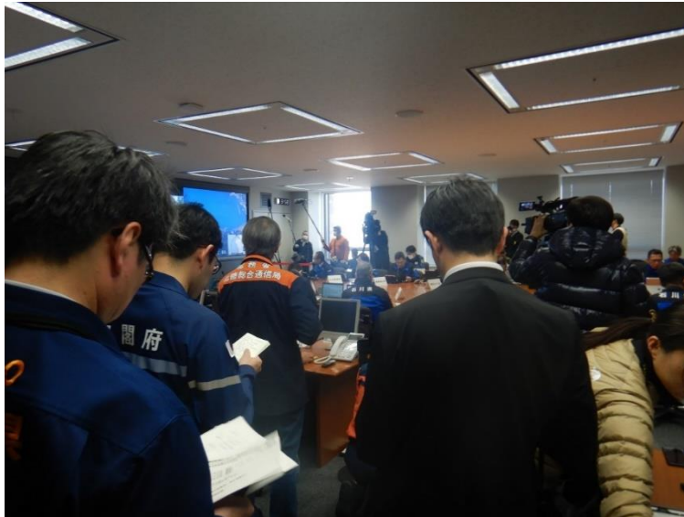
石川県災害対策本部員会議(石川県庁)