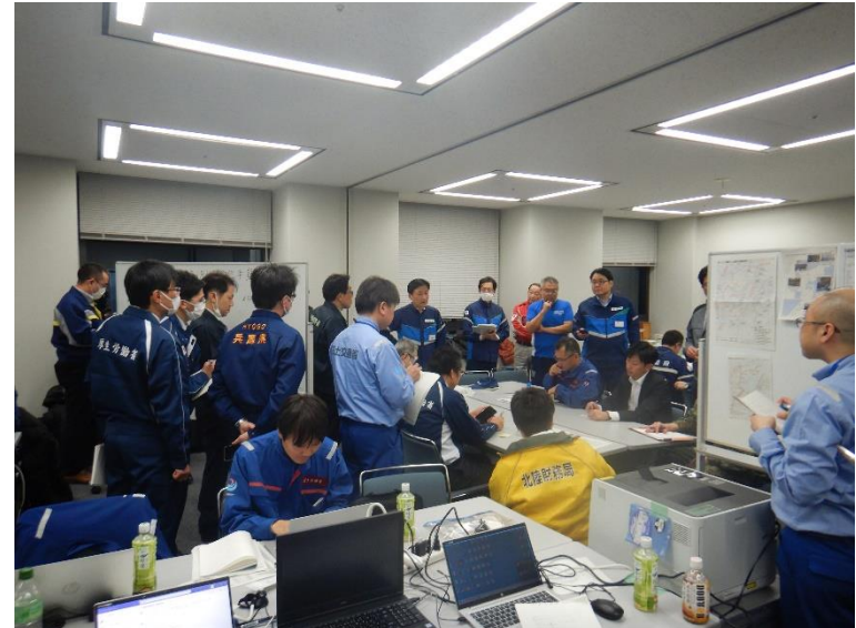
政府現地対策本部との打合せ(石川県庁)