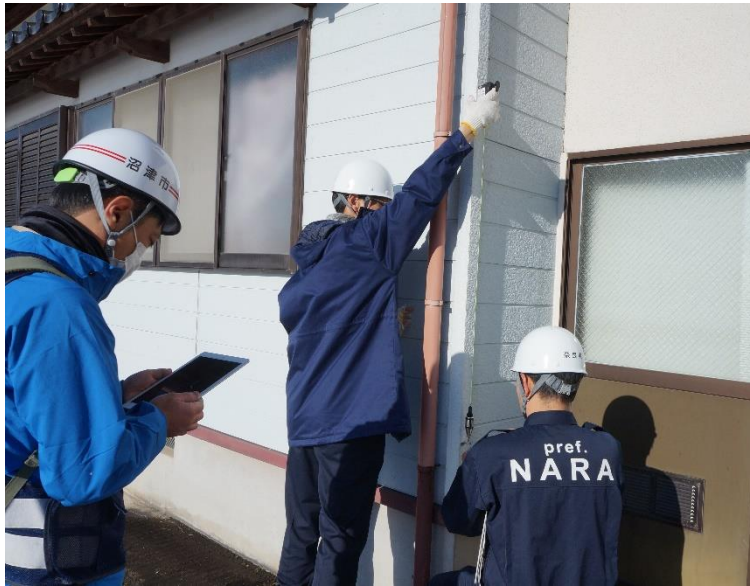
家屋被害認定調査の様子(穴水町内)