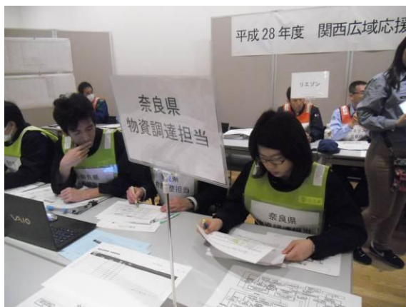
《奈良県物流専門組織》