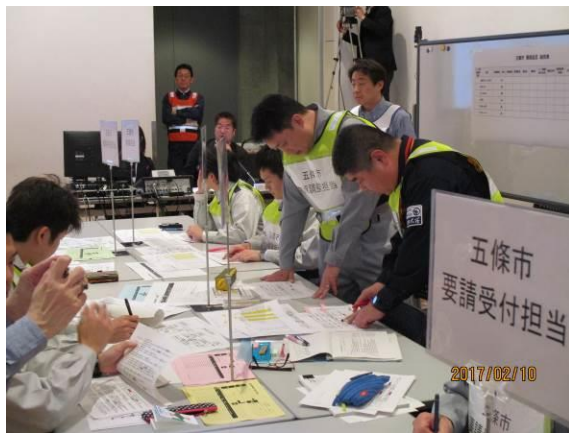
《五條市物流専門組織》