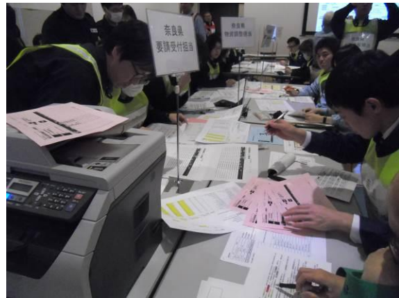
《奈良県物流専門組織》