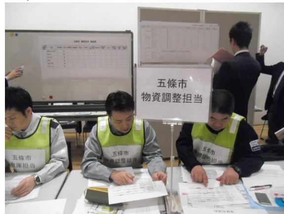
《五條市物流専門組織》