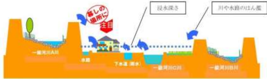
(地先の安全度マップのイメージ)