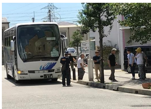
平成30年度原子力総合防災訓練 (福井県高浜町から兵庫県宝塚市への広域避難訓練)