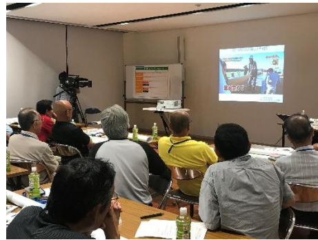
令和元年度住民向け避難行動に関するワークショップ(兵庫県太子町)

・構成団体は、住民が正常性バイアス（自分は災害に遭わないという思い込み）等を認識し、避難行動すべきタイミングに適切な避難行動がとれるよう普及啓発を図る。