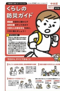
住民向け防災ガイド (神戸市作成)