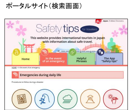
Safety tips ホームページ画面（啓発カードのリンク先）