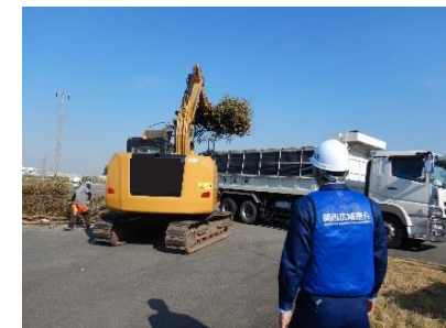
左：倒木除去訓練 右：災害復旧資材の空輸訓練