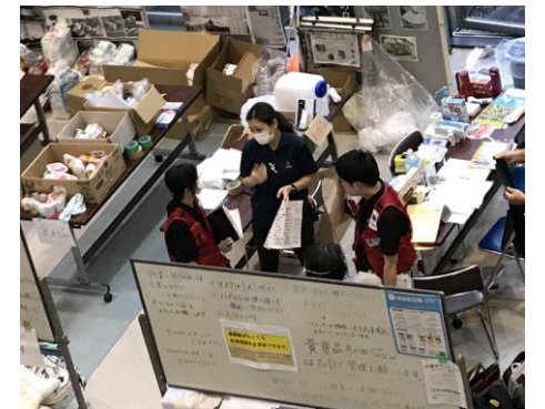
避難所における情報共有（令和2年7月豪雨（熊本））