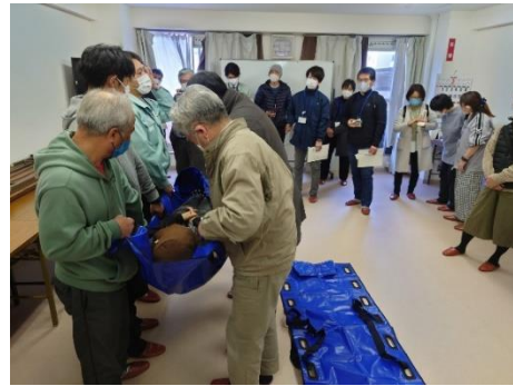
令和2年度避難行動要支援者搬送訓練(兵庫県明石市)

・市町村は、指定避難所内の一般避難スペースでは生活することが困難な障害者等の要配慮者のため、必要に応じて、福祉避難所として指定避難所を指定するよう努める。 ・市町村は、福祉避難所について、受入れを想定していない避難者が避難してくることがないように、必要に応じて、あらかじめ福祉避難所として指定避難所を指定する際に、受入れ対象者（高齢者、障害者等を表記）を特定して公示する。