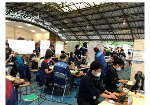
派遣職員の感染症対策（マスク着用・換気）（令和2年7月豪雨（熊本））