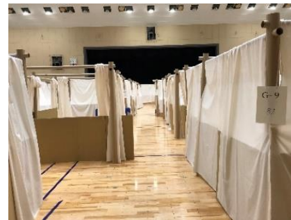
感染症対策に配慮した避難所レイアウト

・応援府県が調達する救援物資に不足が発生する場合に、広域連合が府県間調整を行う救援物資の例として、マスク、消毒液、パーティション等の感染症対策に必要な物資を追記する。