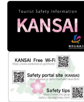
外国人観光客向け啓発カード（上：表面、下：裏面）

・広域連合は、外国人観光客が携帯電話端末等を用いて、QRコードを読みとることで、災害関連情報を入手する方法を周知するための啓発カードの作成・配布により、外国人観光客の円滑な避難を支援する。