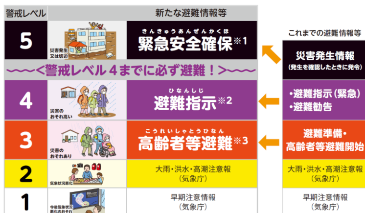
新たな避難情報等と警戒レベル