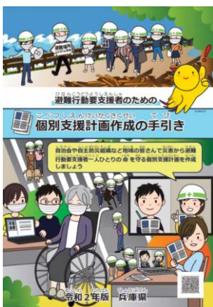
個別避難計画作成の手引き (兵庫県作成)