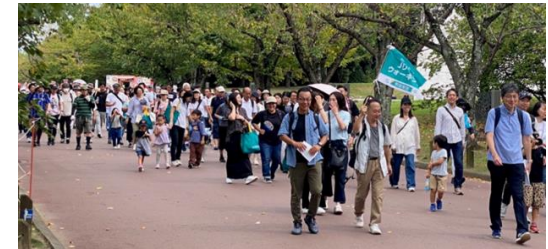
【ジュニアスポーツフェスティバル】