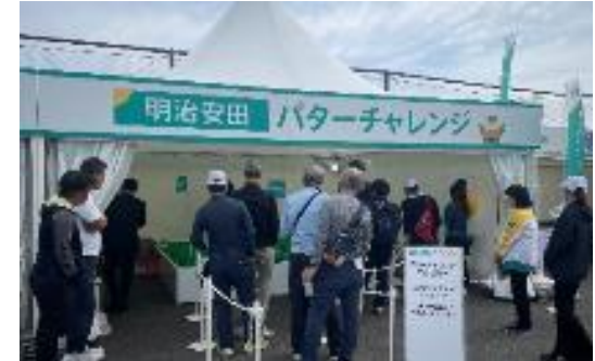
【Jリーグウォーキング】

・健康増進の分野では、日本赤十字社と協働し、献血や循環器病に関して各イベント会場でブース出展し啓発活動を行っている。特に、関西圏においては、一般社団法人ジュニアゴルフクラブチーム連盟主催のジュニアスポーツフェスティバルに特別協賛し、未来世代であるこどもたちにさまざまなスポーツを体験できる機会を提供するとともに、「健活ブース」を出展して来場者の健康意識を高める取り組みを実施している。