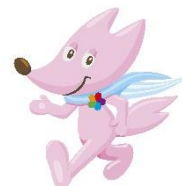
【TSUNAGU プログラムロゴ】 【大会マスコット『スフラ』】