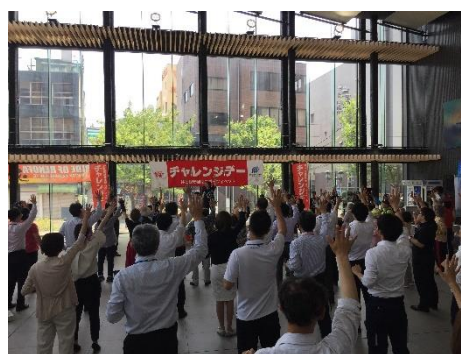
【下関市チャレンジデー2018】