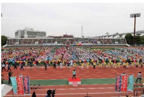
【江戸川区チャレンジデー2018】