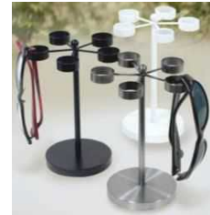
KOZZ create 【堺市】 回転式メガネスタンド シリーズ