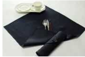
湖東繊維工業協同組合 【滋賀県】 アップサイクル製品 ナフキンにもなる箸袋