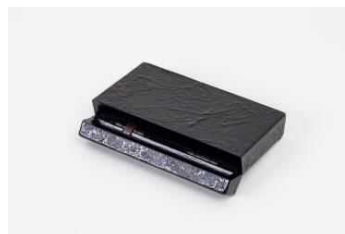
やくの木と漆の館 【京都府】 一閑塗りカードケース