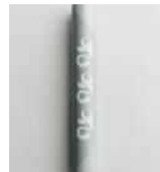
株式会社武田晒工場 【堺市】 さささ和晒ロール Cut