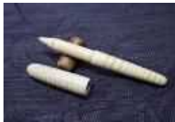
平井木工挽物所 【大阪市】 ボールペン 梶の木