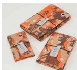
山陽製紙株式会社 【大阪府】 PICNIC RUG