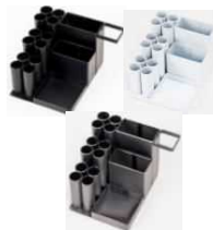
KOZZ create 【堺市】 アイアンペンスタンド