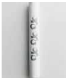
株式会社武田晒工場 【堺市】 さささ和晒ロール Free