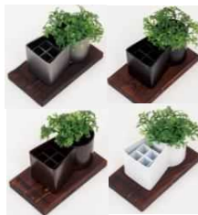
KOZZ create 【堺市】 古墳型ペンスタンド