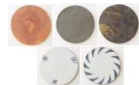
京都陶磁器協同組合連合会 【京都府】 Ceramic plate