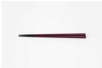
やくの木と漆の館 【京都府】 箸