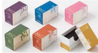
株式会社玉初堂 【大阪市】 ROOM INCENSE LIVING シリーズ