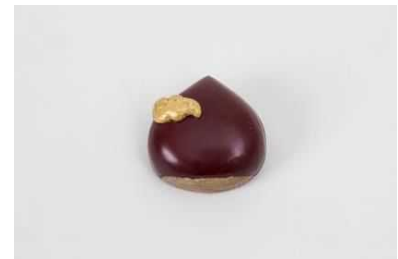
やくの木と漆の館 【京都府】 箸置き