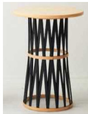
有限会社竹松商店 【滋賀県】 BB テーブル