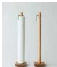
株式会社武田晒工場 【堺市】 さささ和晒ロール Stand