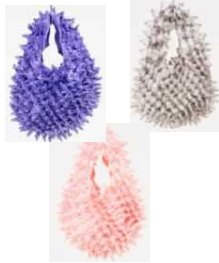
株式会社片山文三郎商店 【京都市】 プチバッグ