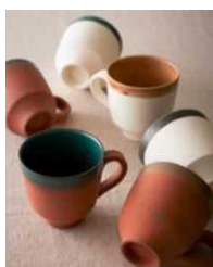
京都陶磁器協同組合連合会 【京都府】 Ceramic Mug