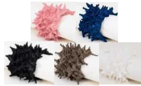
株式会社片山文三郎商店 【京都市】 プレスレット