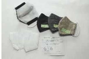
湖東繊維工業協同組合 【滋賀県】 アップサイクル製品 ポケット付きマスク