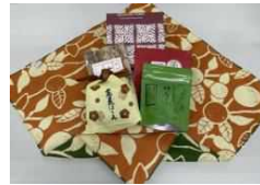
株式会社マルヒサ 【京都府】 京都ふっこう復袋