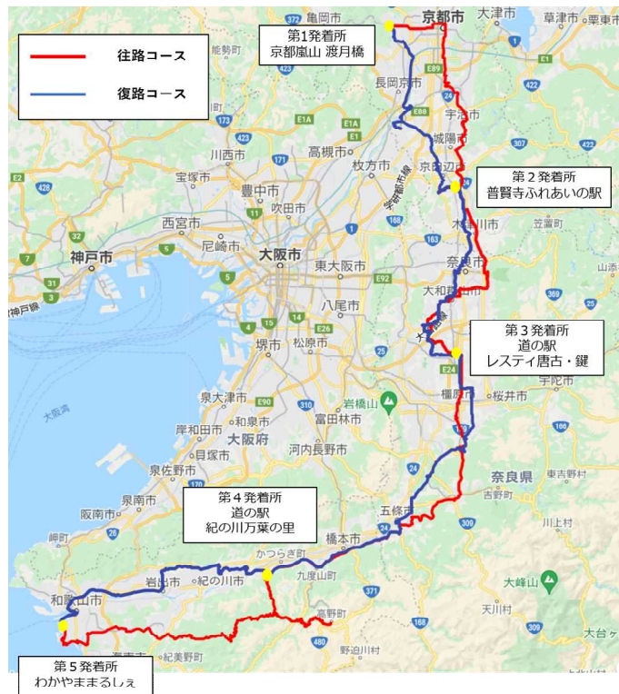
【サイクリングイベントコース図】

7 イベントホームページ https://www.qbei.jp/contents/event/tour-de-kansai.html