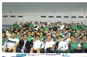
【社員による大会応援】