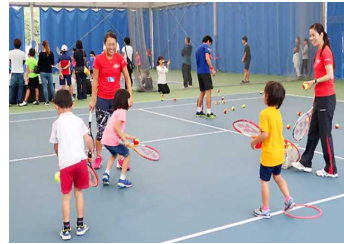
【 テニス教室 】