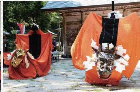
因幡の麒麟獅子舞演舞