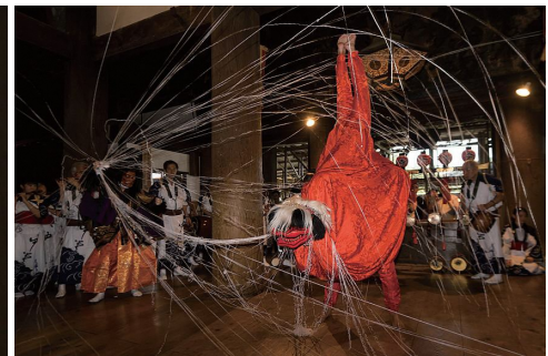
中堂寺六斎念仏踊り