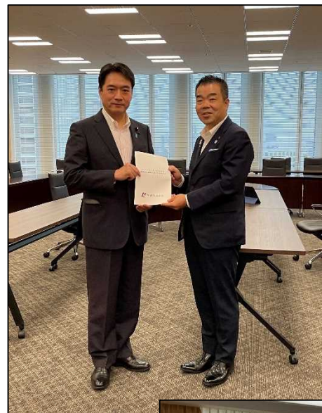
デジタル庁 (6月6日(火))