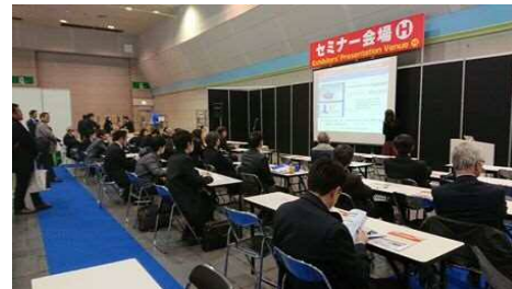
昨年度の様子（ブース、セミナー）