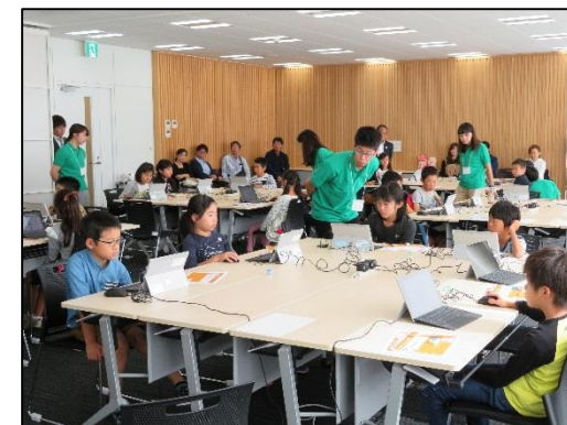
キッズ統計プログラミング in 和歌山

若年層に統計やデータサイエンスへの興味を持ってもらうため、統計を活用したプログラミングのイベントを開催（全国11箇所で開催予定）