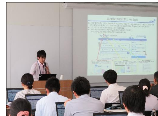
統計データ利活用研修会

統計研究研修所と連携し、E B P M実現に有用なカリキュラムやデータ分析の実践的な内容を盛り込んだ公務員向け研修会を開催（7月25、26日に開催予定）