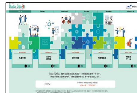
地方公共団体のデータ利活用支援サイト（Data StaRt）（構築中）

地方公共団体のデータ利活用支援サイト（Data StaRt データ・スタート）の構築（5月末開設予定）や、統計データ利活用相談への対応等、統計データ利活用支援の取組を進める