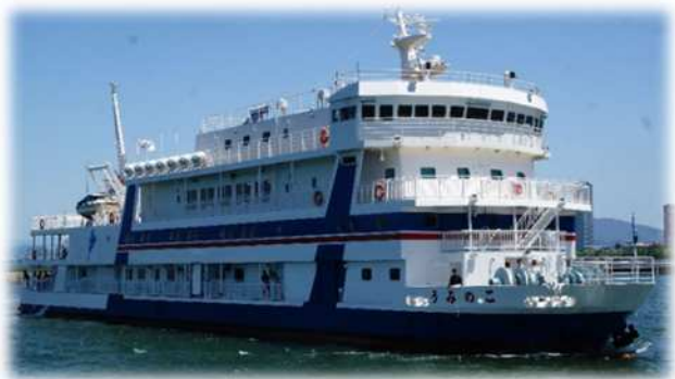
学習船うみのこ (平成 30 年度就航)