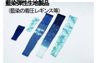
藍染弾性生地製品 (藍染の着圧レギンス等)