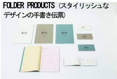
FOLDER PRODUCTS (スタイリッシュなデザインの手書き伝票)