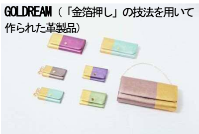
GOLDREAM (「金箔押し」の技法を用いて作られた革製品)