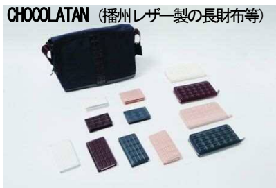
CHOCOLATAN (播州レザー製の長財布等)