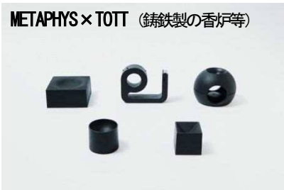
METAPHYS x TOTT (鋳鉄製の香炉等)