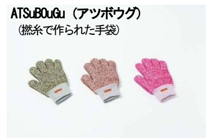
ATSuBOuGu (アツボウグ) (燃糸で作られた手袋)