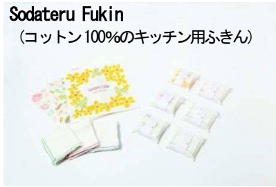
Sodateru Fukin (コットン100%のキッチン用ふきん)