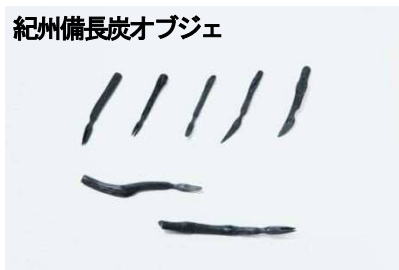
紀州備長炭オブジェ