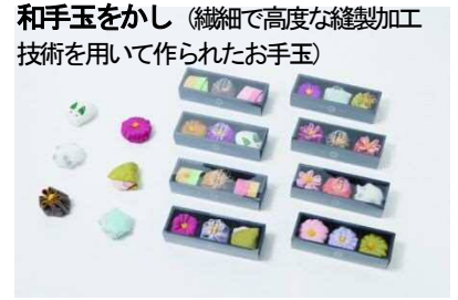
和手玉をかし (繊細で高度な縫製加工技術を用いて作られたお手玉)