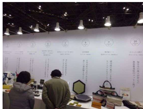
（昨年度の出展の様子）