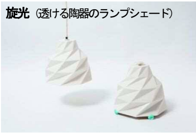
旋光 (透ける陶器のランプシェード)