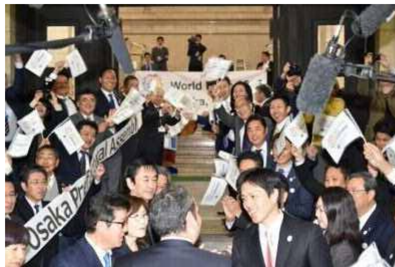
府庁正面玄関における歓迎