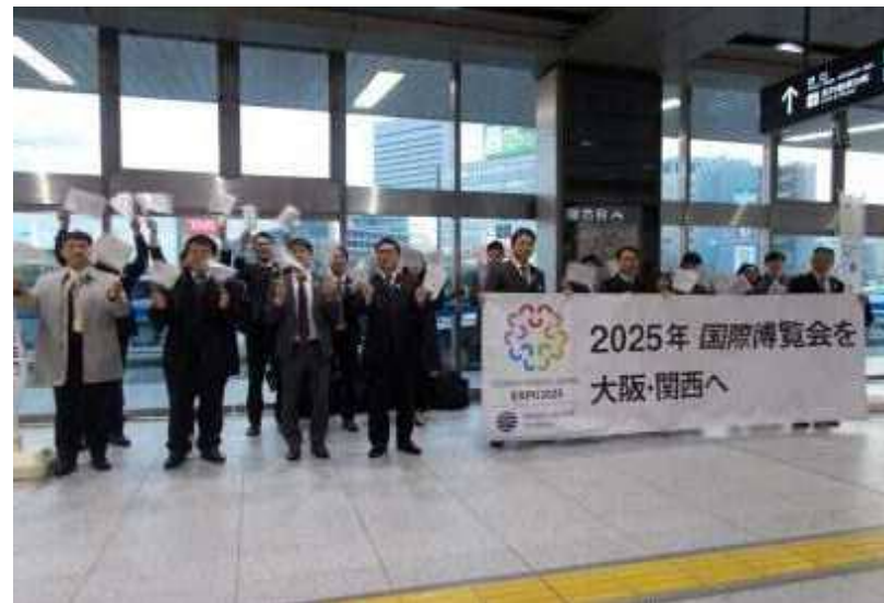
新大阪駅コンコース