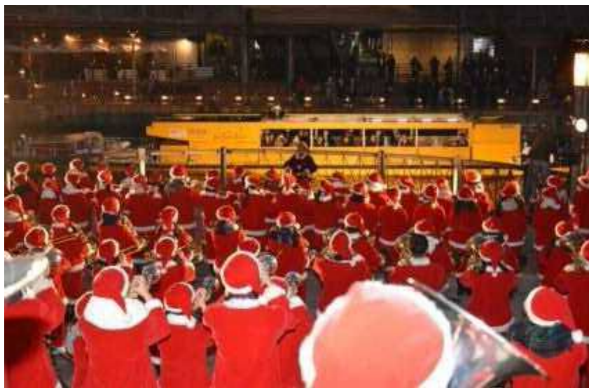
港町リバープレイスでの高校生による吹奏楽