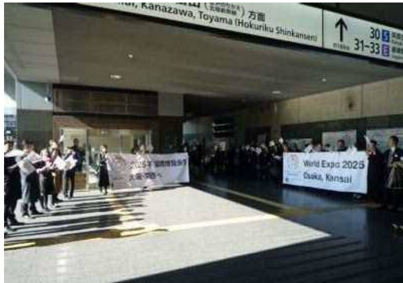
京都駅コンコース②