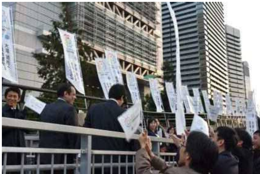
国際会議場前港で乗船