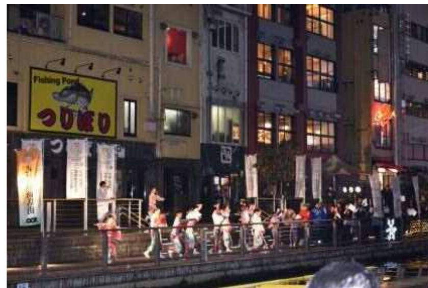
道頓堀でのよさこい祭の演舞