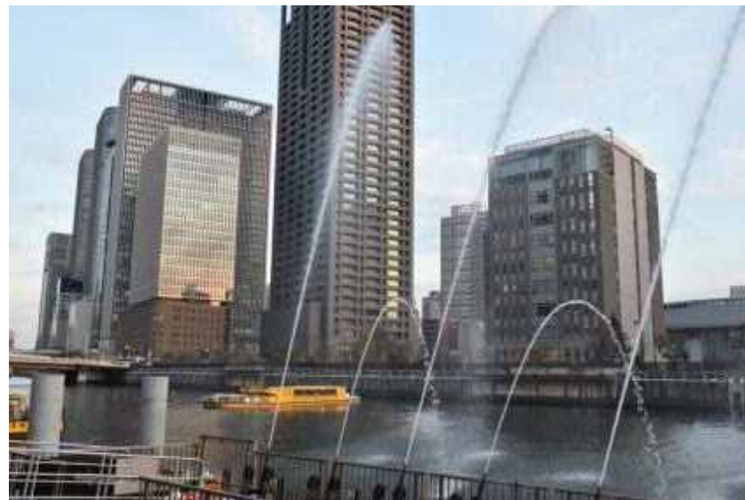
堂島川畔での噴水アトラクション