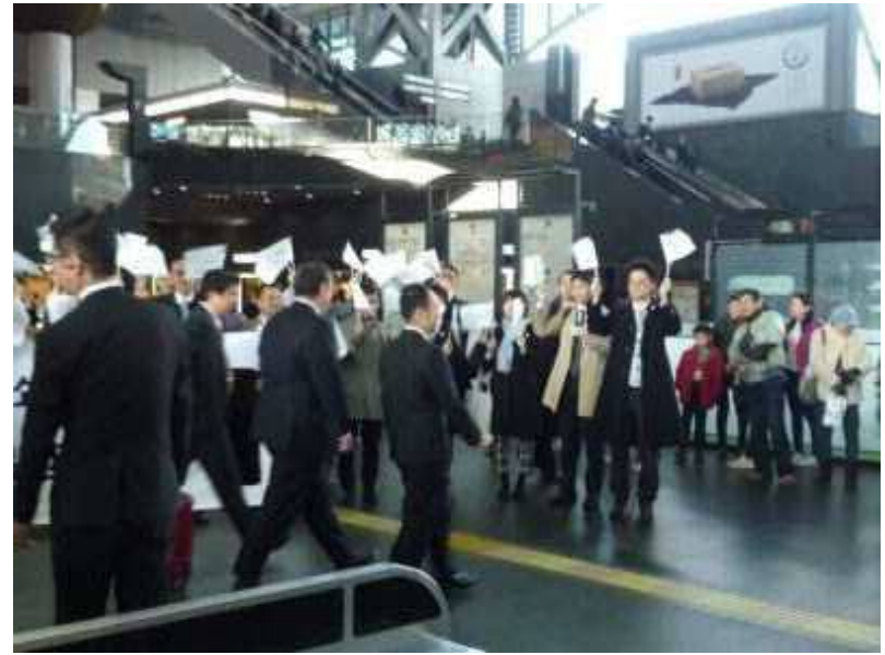
京都駅コンコース①