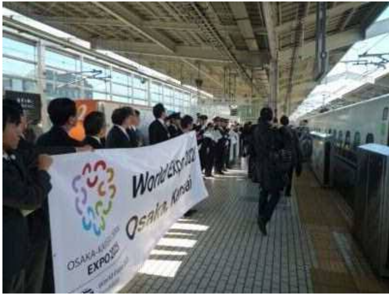
京都駅新幹線ホーム