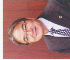
文化庁長官 地域文化創生本部長 宮田 亮平