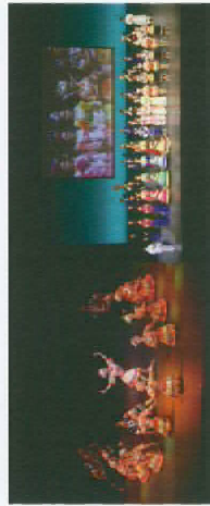
東アジア文化都市2017開幕式典