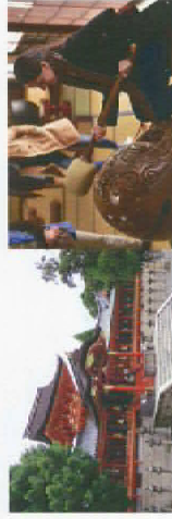
日本文化に開かれた観光客