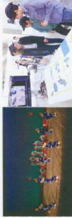
文化庁「ふら」プロジェクト推進部会(新編)