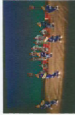
高松市・ふら部会開会