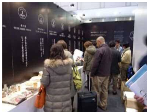
(過去の出展の様子)