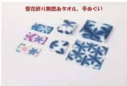
雪花絞り無捻糸タオル、手ぬぐい