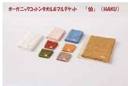
オーガニックコットンタオル&マルチケット「伯」(HAKU)