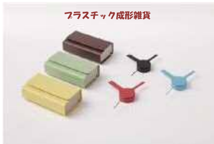
プラスチック成形雑貨