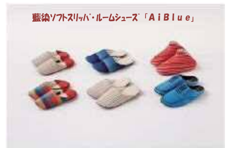
藍染ソフトスリッパ・ルームシューズ「AiBlue」