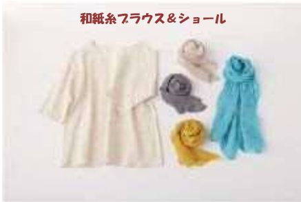
和紙糸フラウス&ショール