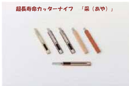
超長寿命カッターナイフ「采(あや)」