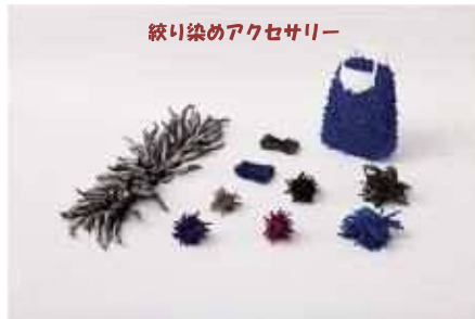
絞り染めアクセサリ