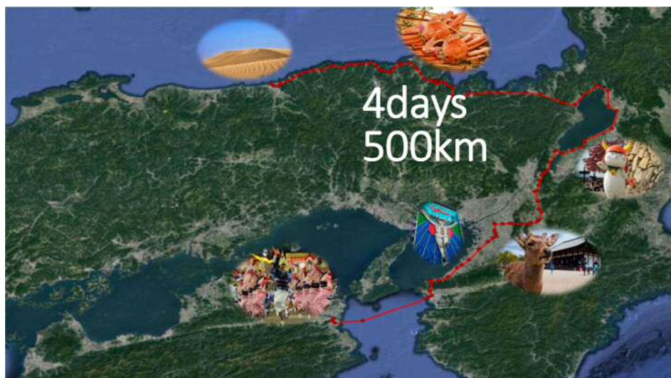
「Tour de Kansai」 想定ルートイメージ