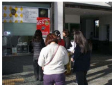
兵庫陶芸美術館 (11/14・15)