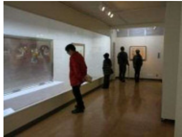
京都市学校歴史博物館 (11/14・15)