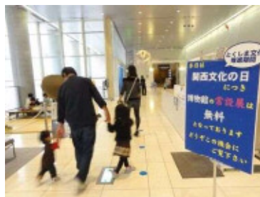
徳島県立博物館 (11/3～15・23)