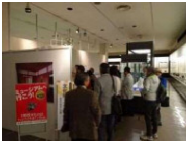
福井県立一乗谷朝倉氏遺跡資料館 (11/14・15)