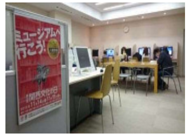
大阪府立上方演芸資料館 (ワツハ上方) (11/14・15)