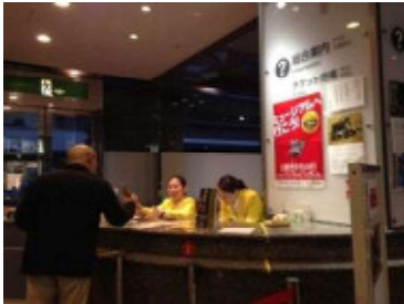
京都文化博物館 (11/14・15)