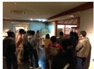
和歌山県立紀伊風土紀の丘 (11/14・15)