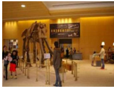
MieMu:三重県総合博物館 (11/14・15)