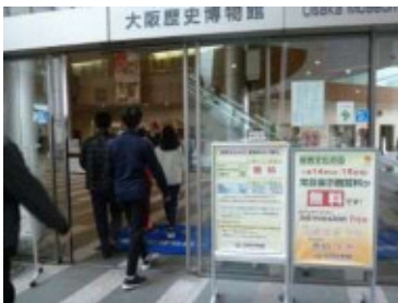
大阪歴史博物館 (11/14・15)