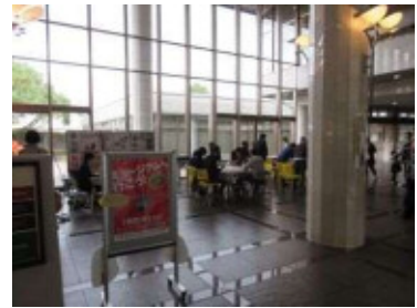
滋賀県立近代美術館 (11/14・15)