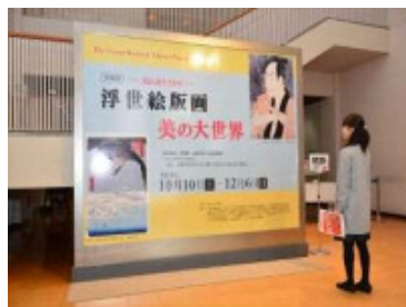
奈良県立美術館 (11/14・15)