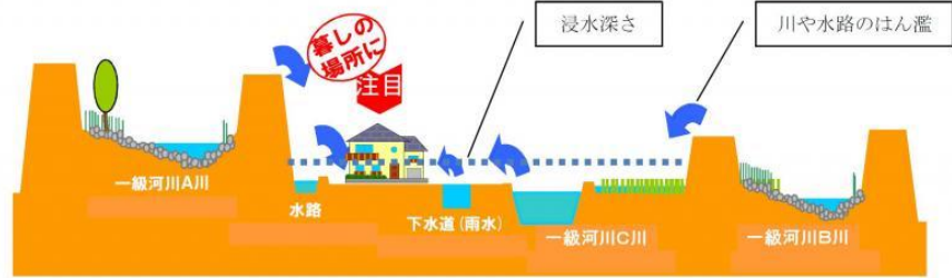
(地先の安全度マップのイメージ)