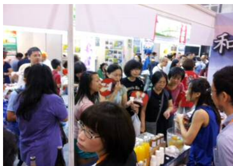
香港フードエキスポ2013