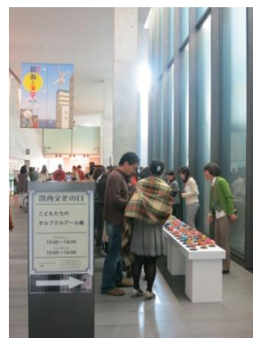
兵庫県立美術館(11/9・10)