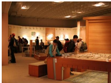
斎宮歴史博物館(11/16・17)