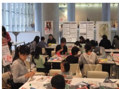
徳島県立近代美術館(11/3～17、23)