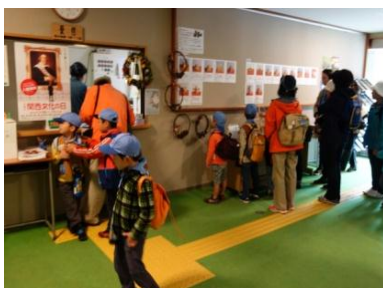
和歌山県立紀伊風土記の丘(11/16・17)