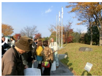
奈良県立万葉文化館(11/16・17)