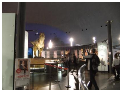
福井県立恐竜博物館(11/16・17)