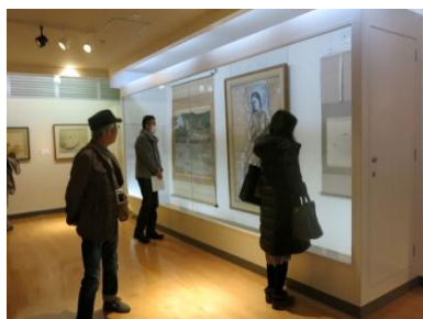
京都市学校歴史博物館(11/16・17)