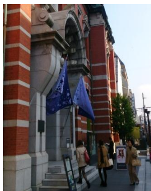
京都文化博物館(11/16・17)