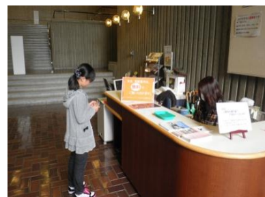
鳥取県立博物館(11/16・17)