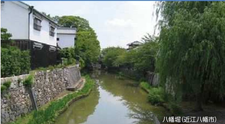
八幡堀(近江八幡市)

地域の歴史的魅力や特色を通じて我が国の文化・伝統を語るストーリーとして、文化庁が「日本遺産」の認定をスタートしてから5年。本年は、選定最終年の節目となりました。