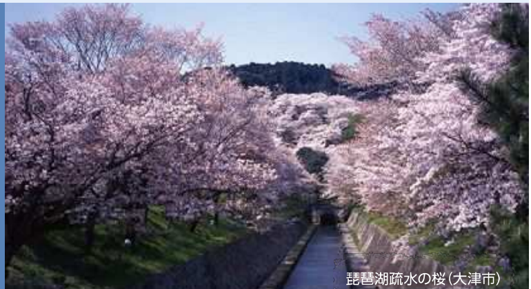
琵琶湖疏水の桜(大津市)