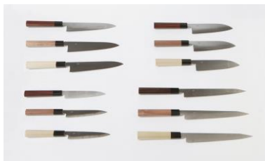
八内刃物製作所 【堺市】 堺包丁 ei series