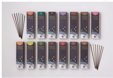
兵庫県線香協同組合 【兵庫県】 あわじ島の香司 日本の香り