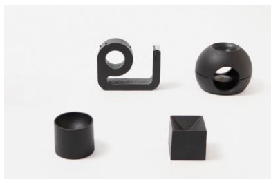
株式会社松田安鐵工 【鳥取県】 茶香炉「saen」他