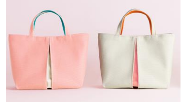
光章 【京都市】 KOSHO ougi 帆布トートバッグ