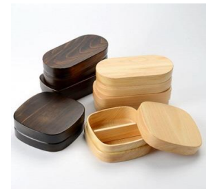
株式会社角田清兵衛商店 【和歌山県】 紀州桜弁当箱 ナノコート