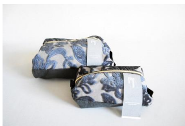
妙中パイル織物株式会社 【和歌山県】 Taenaka No Nuno 「バッグ・ポーチ・小物など」