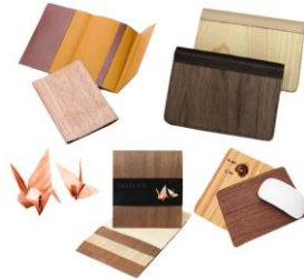
株式会社ビッグウィル 【徳島県】 折り樹、樹のカードケースなど