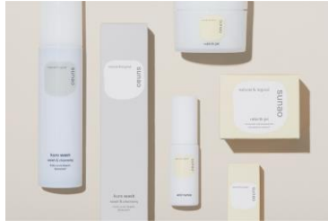
株式会社 sunao 【京都市】 クロウォッシュ (クレンジング洗顔) 他