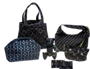
鳥取県弓浜緋協同組合 （弓浜緋工房B）【鳥取県】 弓浜緋バッグ等