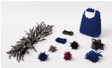
株式会社 片山文三郎商店 【京都市】 絞り染めアクセサリー