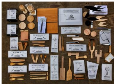
standardworks (urban ole ecopark) 【兵庫県】 Wooden handmade kit