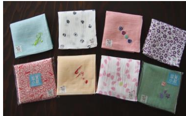
湖東繊維工業協同組合 【滋賀県】 近江の麻 近江ちぢみ 「滋賀小紋のハンカチ」