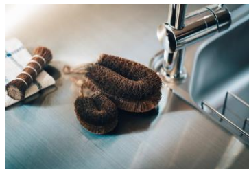
高田耕造商店 【和歌山県】 棕櫚たわし、棕櫚ほうき