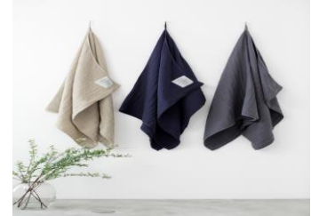
神藤タオル株式会社 【大阪府】 2.5-PLY GAUZE TOWEL