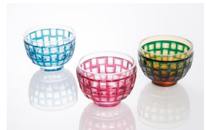
たくみ工房 【大阪市】 大阪たくみ切子 盃「あじろ」