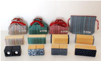
ヨシモク 【徳島県】 藍木スピーカー檜他