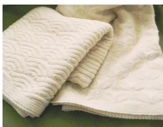
一般財団法人境港市農業公社 【鳥取県】 伯州綿ブランケット他