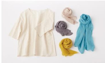
株式会社古川与助商店 【滋賀県】 和紙系商品