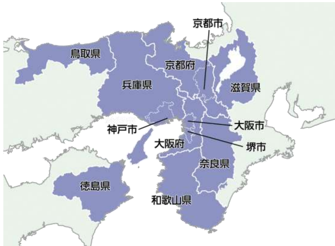
※国土数値情報（行政区画データ）を用いて作図