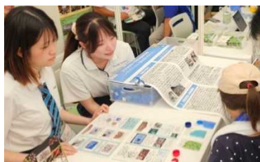
企業・学生・団体等の参画による体験型ワークショップ・ブース出展