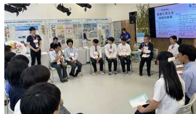
クロージングイベント 上流・中流・下流の高校生と三日月連合長との意見交換