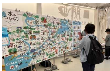
水のつながりを表現したイラストパネル