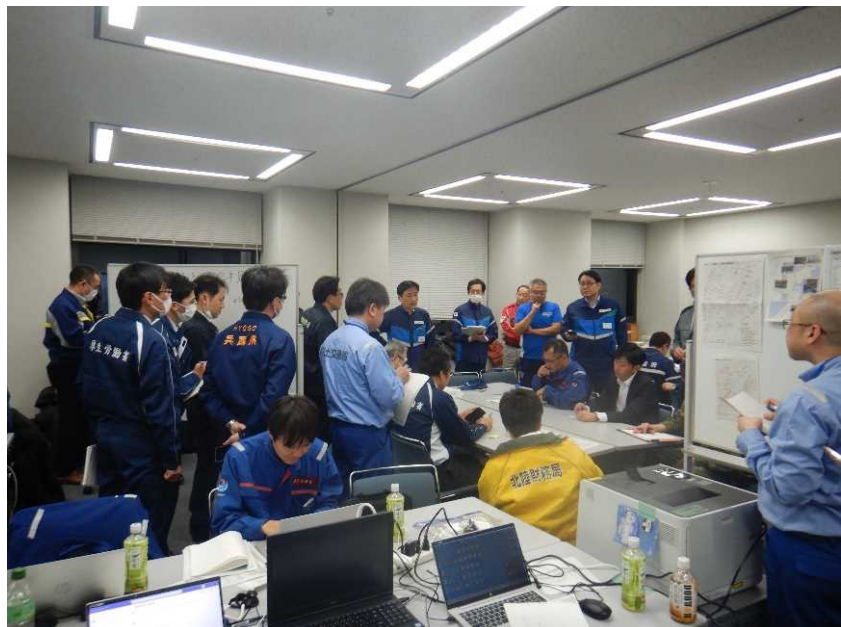
政府現地対策本部との打合せ(石川県庁)