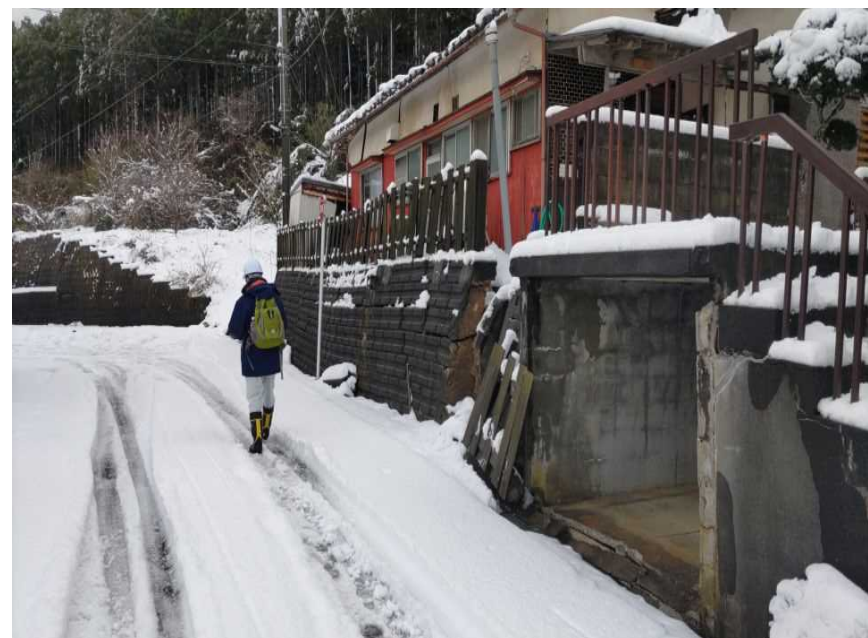
応急危険度判定の様子(志賀町内)