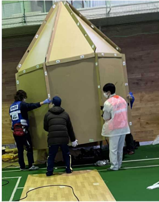
避難所支援(輪島中学校)