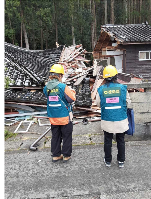
保健師在宅訪問の様子(輪島市内)