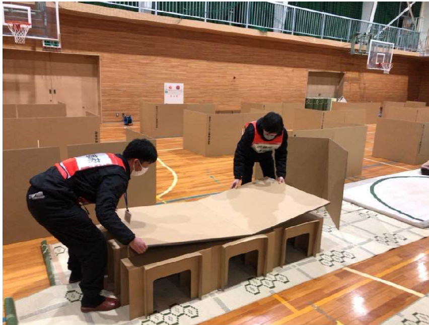
避難所支援(七尾市立中島小学校)