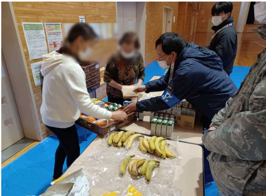
避難所支援(能登町立柳田小学校)