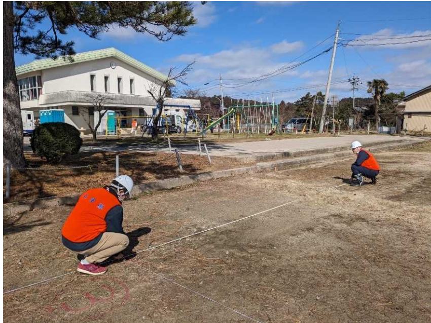
応急仮設住宅建設支援(珠洲市内)