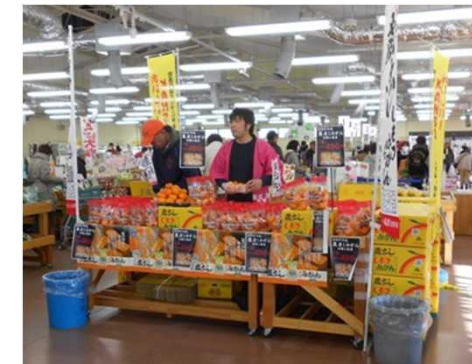
直売所交流によるイベント