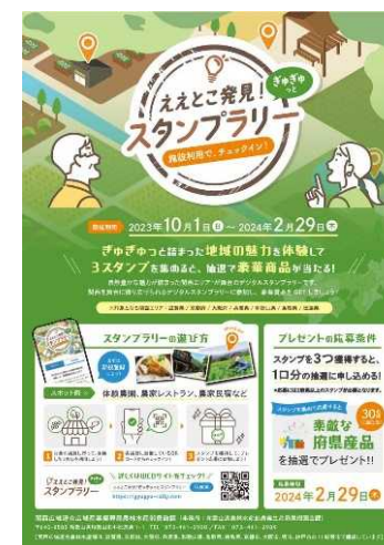
デジタルスタンプラリー