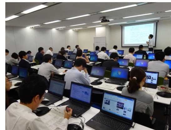
・谷道講師による講義