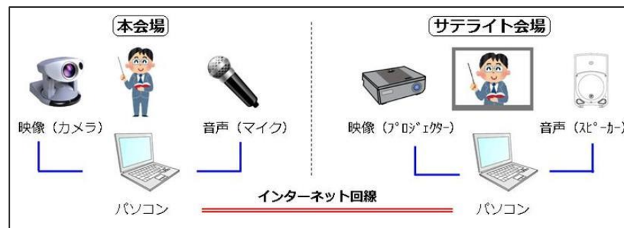
WEB型研修のイメージ