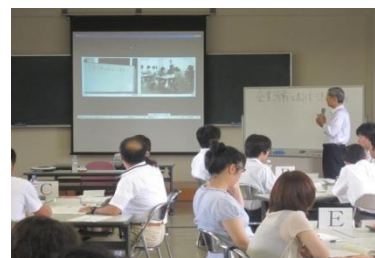
• WEB型研修 本会場の様子