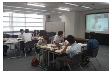
• WEB型研修 サテライト会場の様子