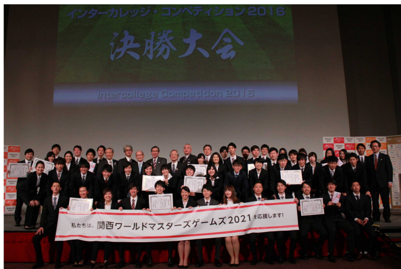
【インターカレッジコンペティション 2016 決勝大会】

関西ワールドマスターズゲームズ2021組織委員会が実施する「インターカレッジコンペティション2017」を支援します。