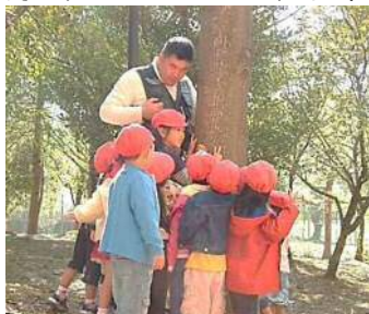
自然の中でのあそびと 学びを公開保育します!!