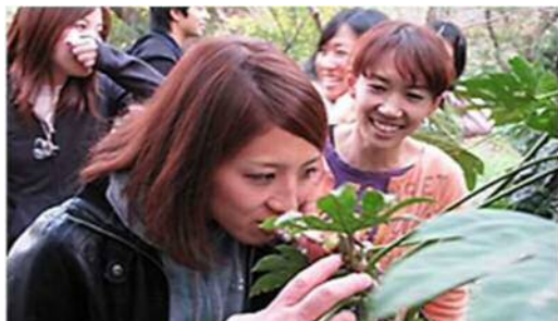
子どもが楽しむには、まず先生から。 あそび・保育の幅が広がります!!