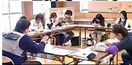
公開保育でのねらいや地域の 自然の活かし方など、環境学 習のノウハウを解説します!!