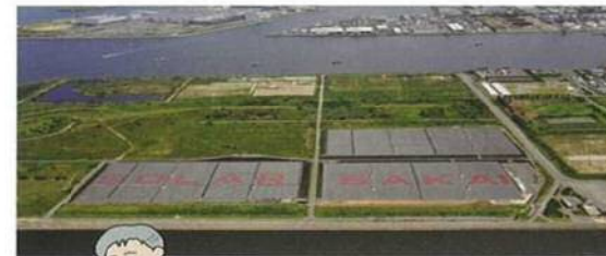
メガソーラー(堺市)