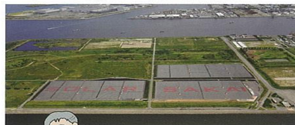
メガソーラー (堺市)