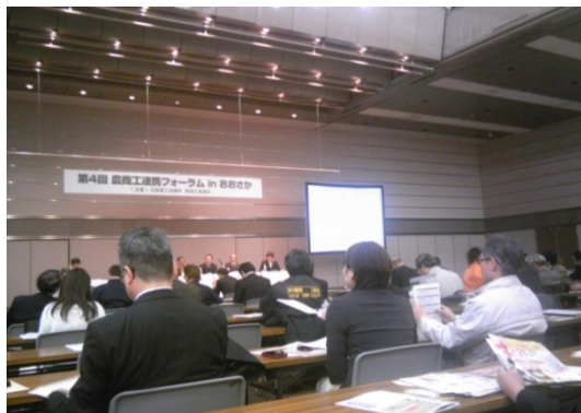
H25農商工連携フォーラム in おおさか

参考) H25実績 農商工連携フォーラム(1月30日、大阪市) 農林水産業者の参加・提案 12社