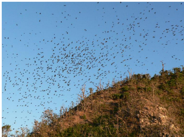
ねぐらから飛び立つカワウと枯死木