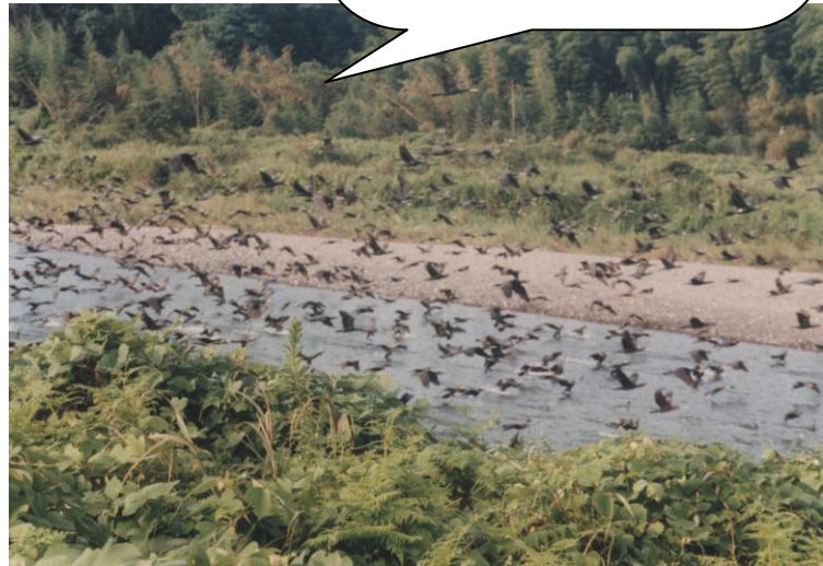
漁場で大群で飛来するカワウ