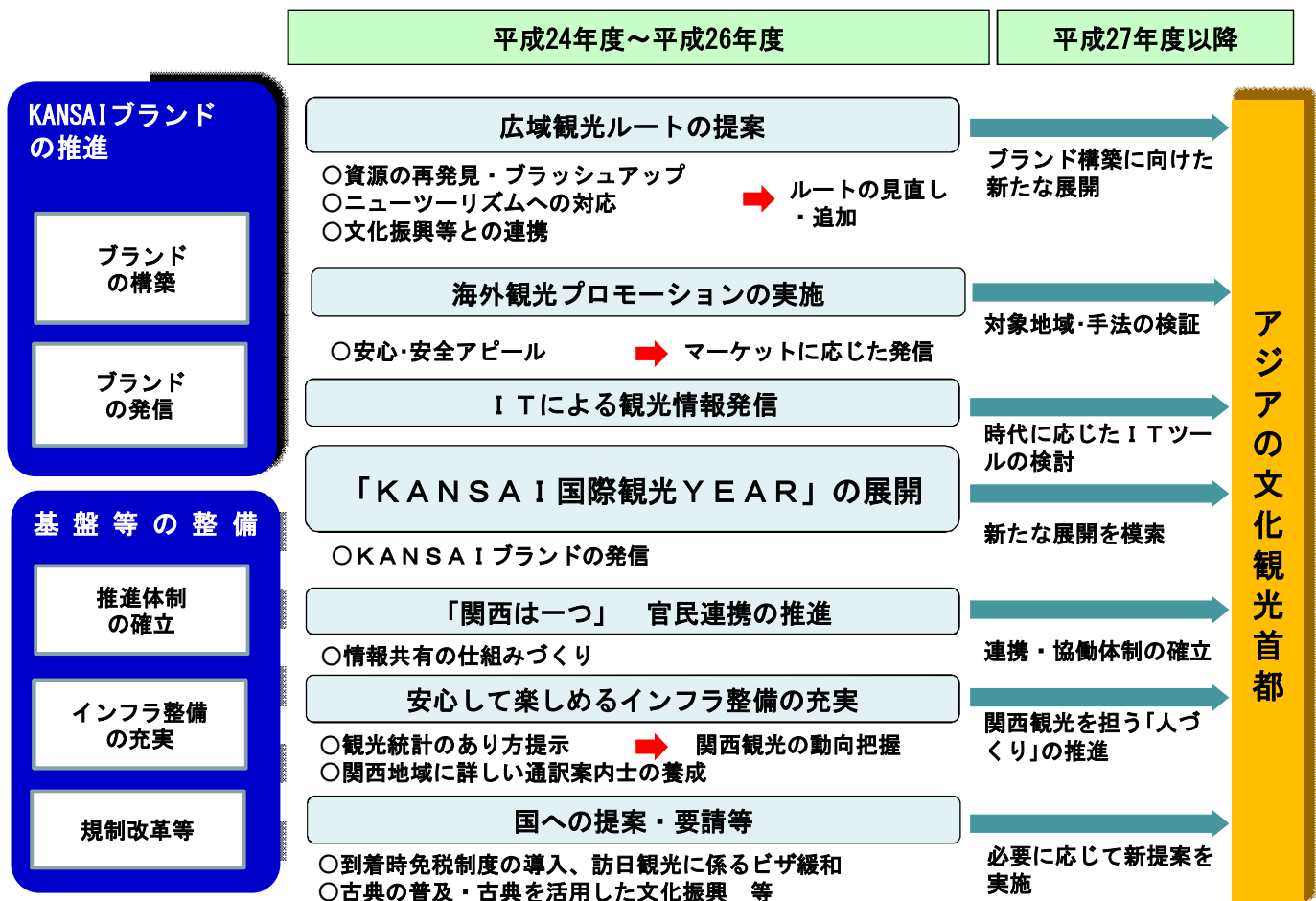
図3 関西観光・文化振興計画 事業推進計画