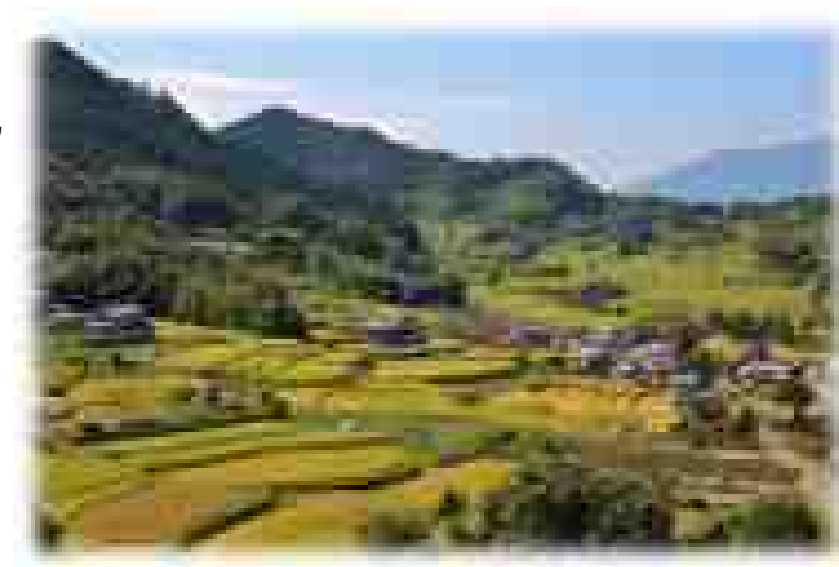
明日香村の風景