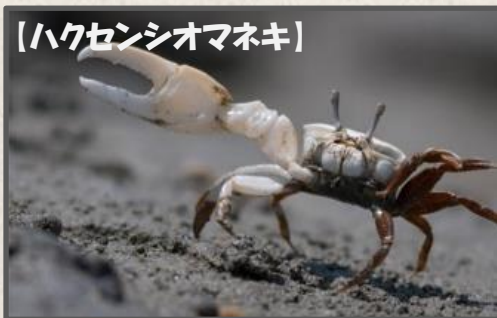
【ハクセンシオマネキ】