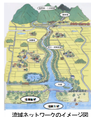
流域ネットワークのイメージ図