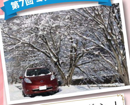
「桜並木～冬ヴァージョン～」 (滋賀県 湖南市)