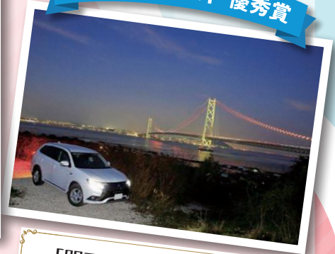
「明石海峡を背にして」 (兵庫県 淡路市)